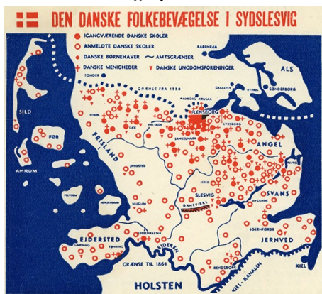
Fra en af udvalgets første udgivelser.

På hjemmesiden og i bladet har du mulighed for at holde dig orienteret om historien og nyheder.