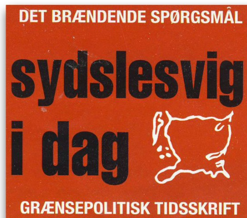
Fra bladets forside.

Sydslesvigsk Udvalg af 5. maj 1945 ”Sydslesvig i dag” Louisevej 2A DK-6100 Haderslev